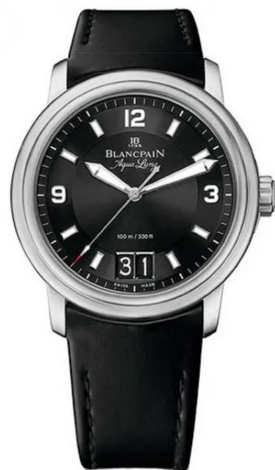
Владимир Путин в часах Blancpain Aqua Lung Lemans Grande Date на ПМЭФ-2021